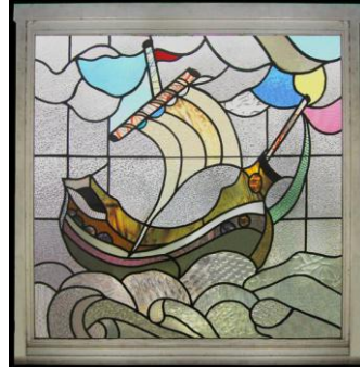
شكل ( ٣ ) الرسم على الزجاج في لمشغولات الفنية الحديثة (٢٠١٤)