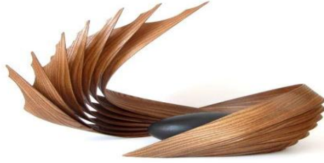
"The Nest" by Eric Tardif, Canada

الشكل ٦: استخدام الرقائق الخشبية للفنان تكسبار (Txaber)