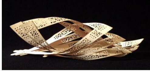
شكل ( ٤ ) مشغوله فنية حديثة باستخدام الاخشاب (نخيلة، ٢٠١٤):